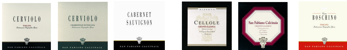
“I nostri vini”