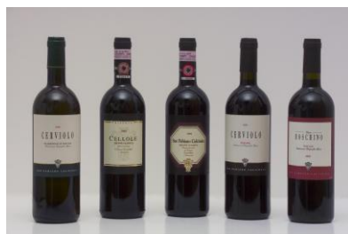
“I nostri vini”