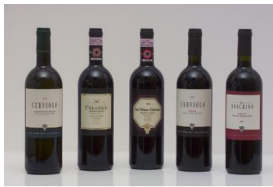
“I nostri vini”